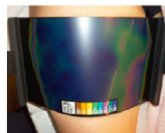
Dopo i trattamenti